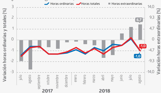
Evolución de la variación de las horas pagadas por trabajador base anual 2016=100 Variaciones 12 meses* (julio 2017 - agosto 2018)